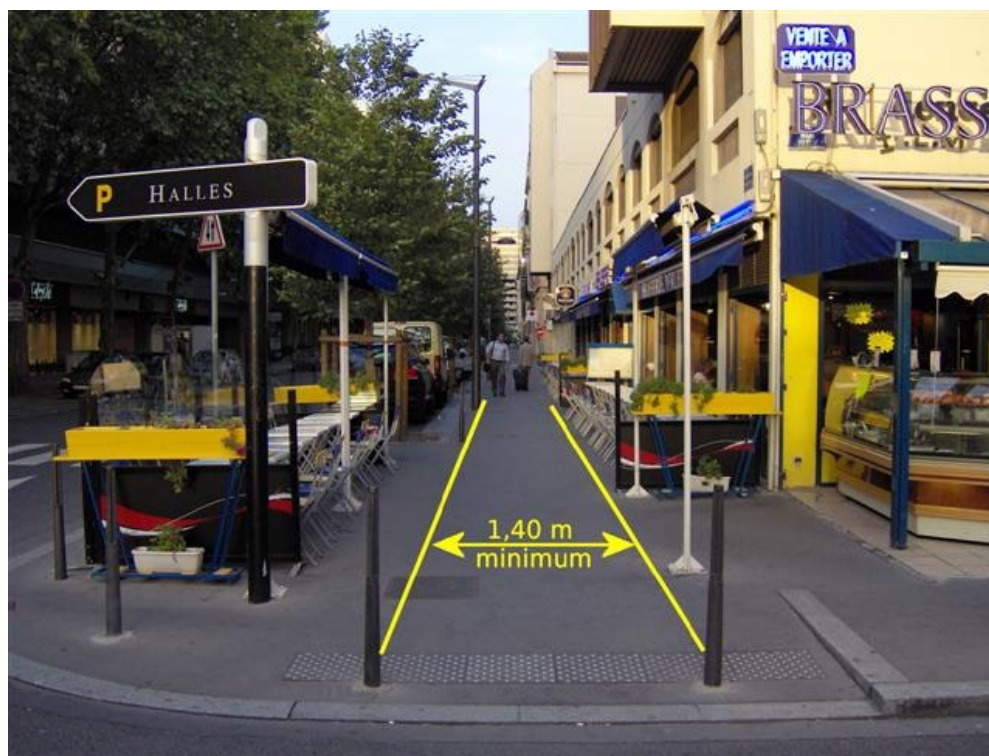
Figure 1 Cheminement libre sur un trottoir