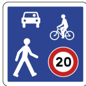
Panneau zone de rencontre

La zone de rencontre se définit sur le plan réglementaire comme une zone à priorité piétonne. Ouverte à tous les modes de circulation, les piétons peuvent s'y déplacer sur toute la largeur de la voirie en bénéficiant de la priorité sur l'ensemble des véhicules (à l'exception des transports guidés en permanence).