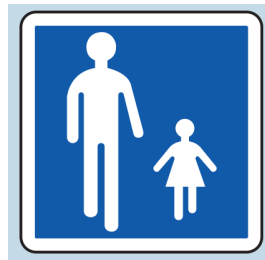
Panneau aire piétonne

L'aire piétonne est définie réglementairement comme « une section ou ensemble de sections de voies en agglomération affectée à la circulation des piétons de façon temporaire ou permanente ».